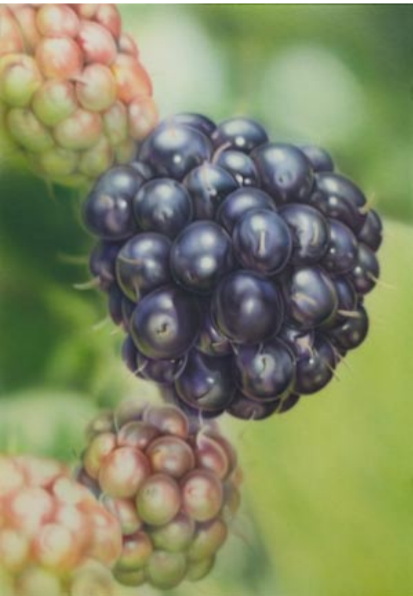
Olivgrün 1 / 5 Wasser für Reflektionen und Radierer