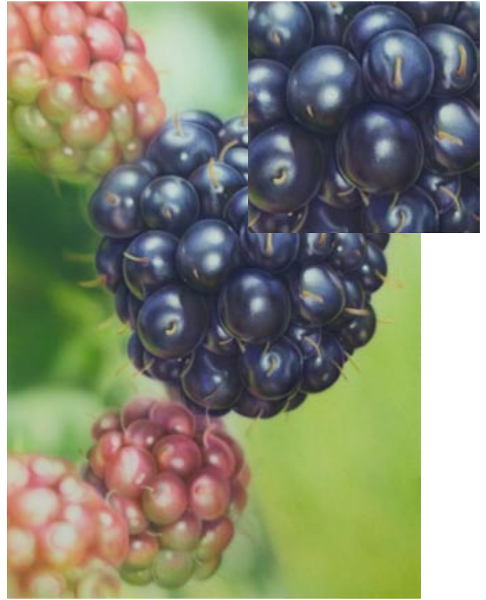
Indigo 1 / 5 Wasser anschließend Ra- dierer