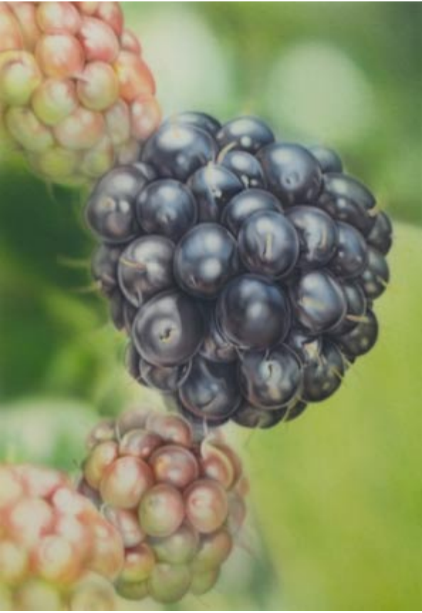
Preußischblau 1 / 10 Wasser