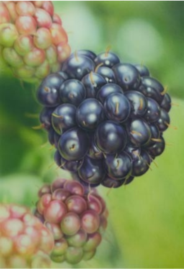
Kraprot hell 1 / 5 Wasser