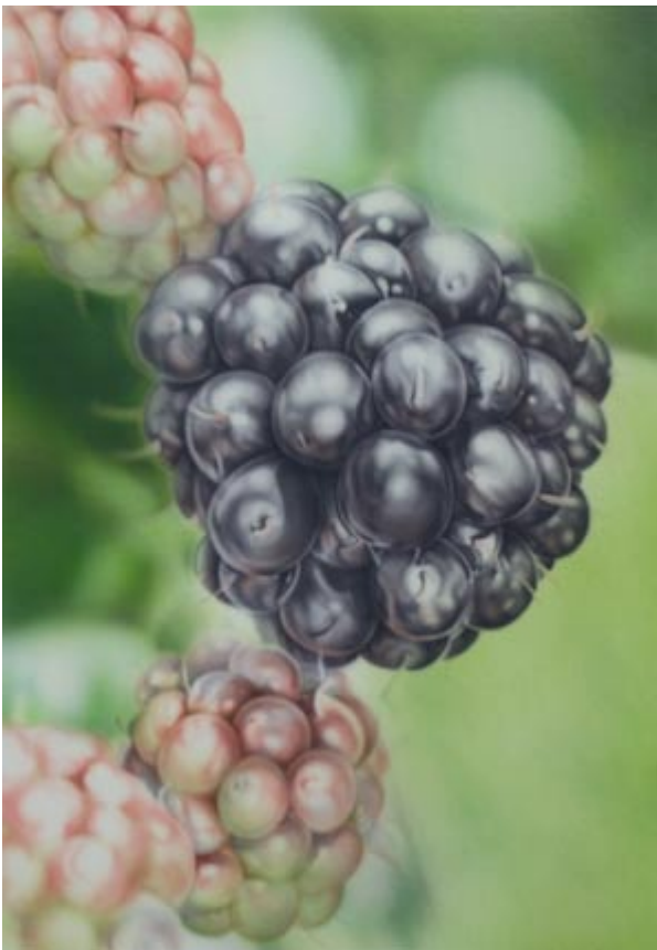
Olivgrün und anschließend Neutral- grau je 1 / 5 für Hintergrund und abdunkeln der roten Beeren