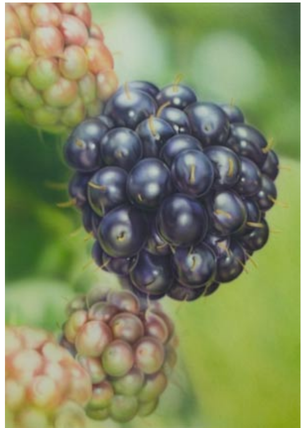
Siena 2 / 5 Wasser