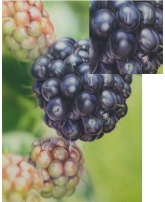
Preußischblau 1 / 10 Wasser dann Violett 1 / 5 Wasser