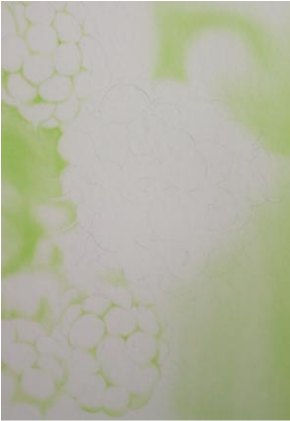
Permanentgrün 1 / 5 Wasser