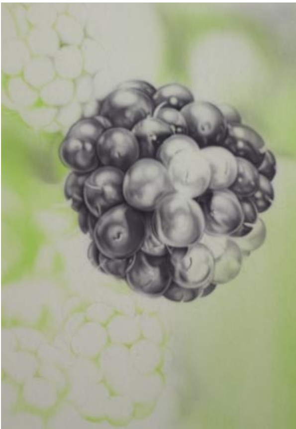
Anlage Neutralgrau 1 zu 3