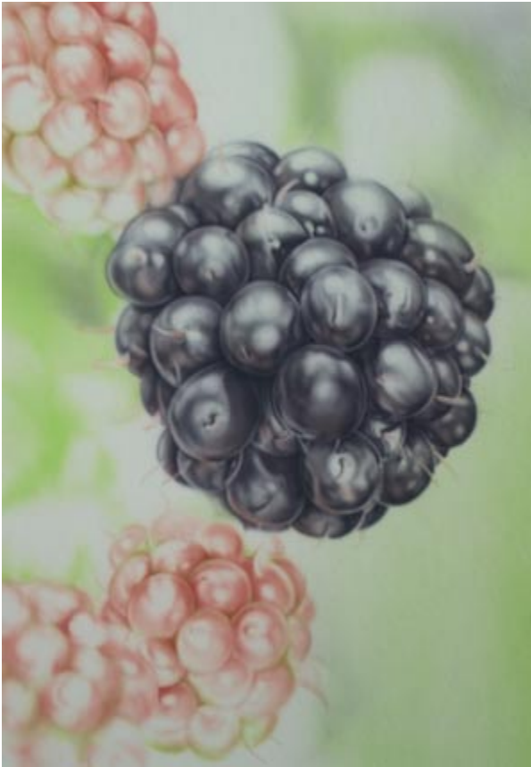
Kraprot tief 1 / 5 Wasser