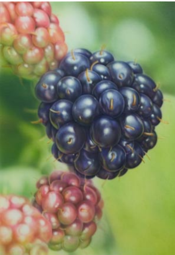
Scharlach 1 / 10 Wasser