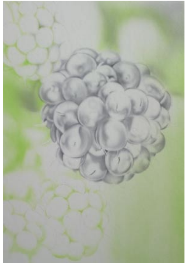
Neutralgrau 1 / 5 Wasser