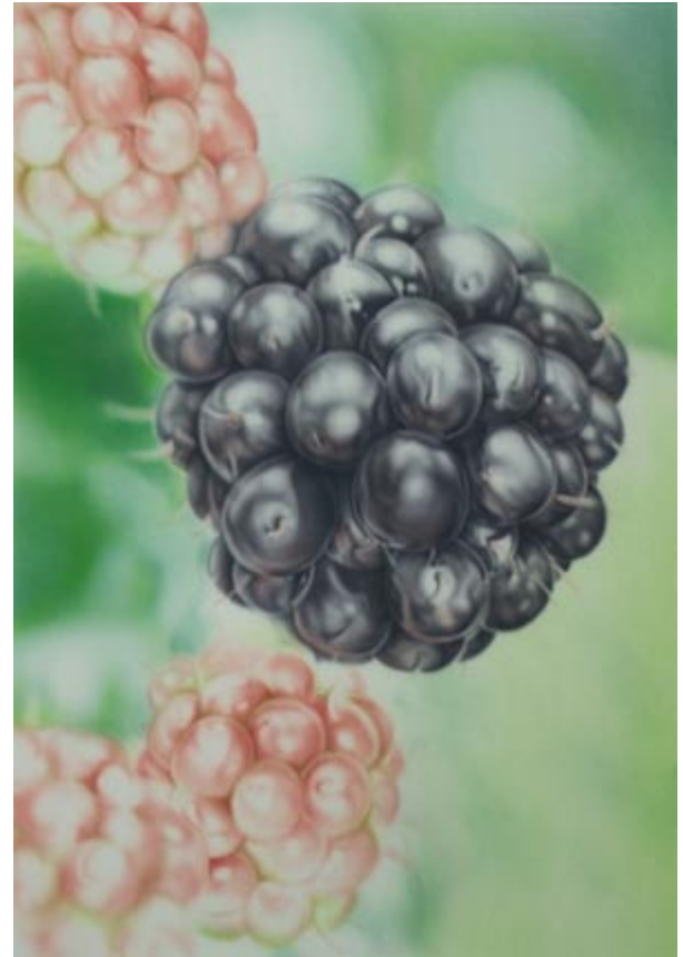
Chromoxidgrün 1 / 5 Wasser für Hinter- grund