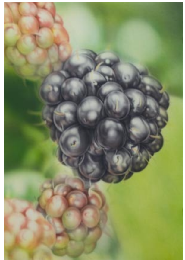
Indischgelb 1 / 5 Wasser